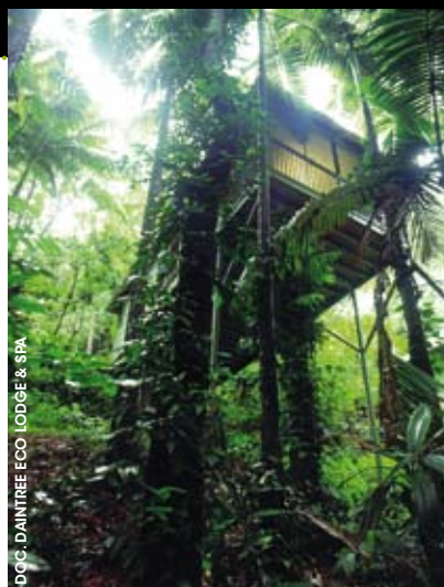
DOC. DAINTREE ECO LODGE &amp; SPA