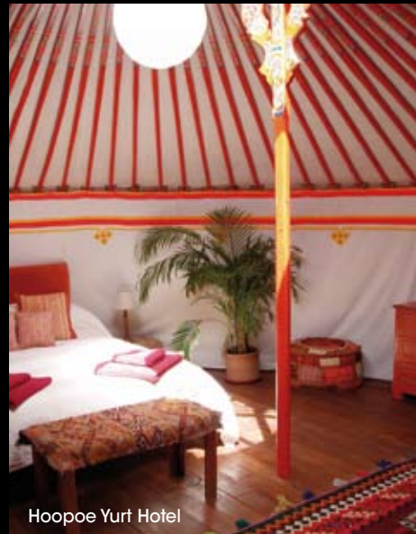
Hoopoe Yurt Hotel

den in de steppen van Centraal-Azië. Het Hoopoe Yurt Hotel biedt vijf individueel ingerichte yurts die op zonne-energie werken en gebruikmaken van een biologisch toilet. Ze liggen verspreid over een terrein van drie hectare en proberen zo weinig mogelijk inbreuk te plegen op de omringende vegetatie.