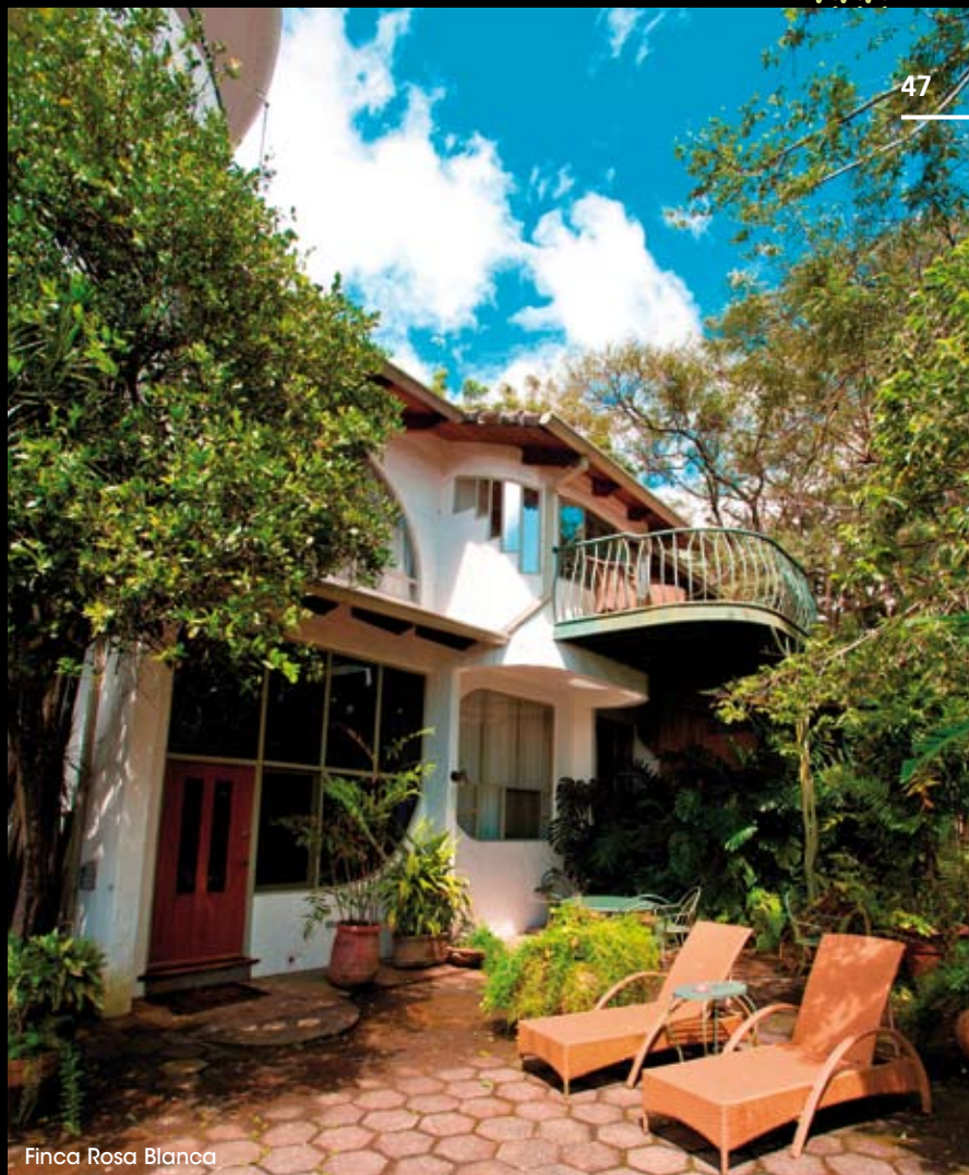
Finca Rosa Blanca