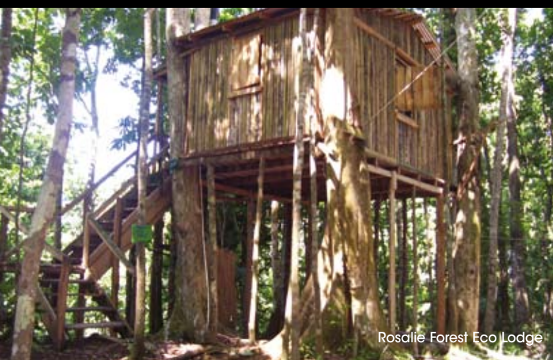
Rosalie Forest Eco Lodge