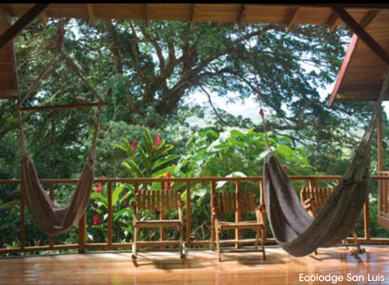
Ecolodge San Luis